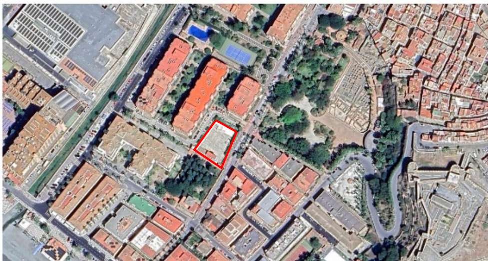
- PLANTA DE ACTUACIÓN DE LA REHABILITACIÓN -