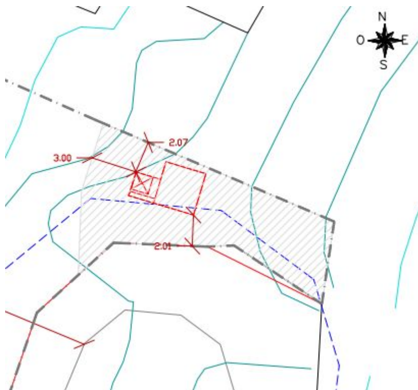
Plano de situación sobre la parcela

El contrato definido tiene la calificación de contrato privado, tal y como establece el artículo 9 de la Ley 9/2017, de 8 de noviembre, de Contratos del Sector Público, por la que se transponen al ordenamiento jurídico español las Directivas del Parlamento Europeo y del Consejo 2014/23/UE y 2014/24/UE, de 26 de febrero de 2014.